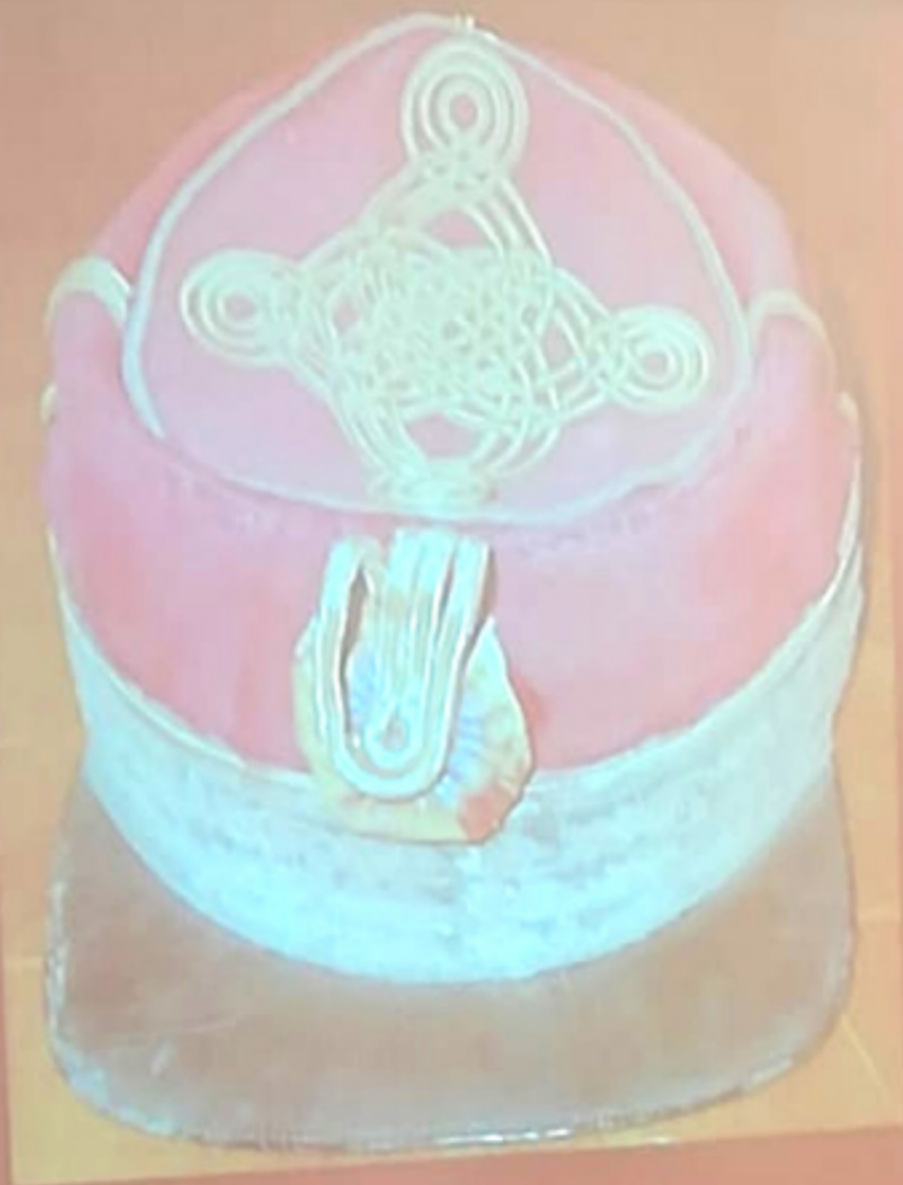
Chipiul medicului Carol Davila Muzeul Militar Național "Regele Ferdinand I"