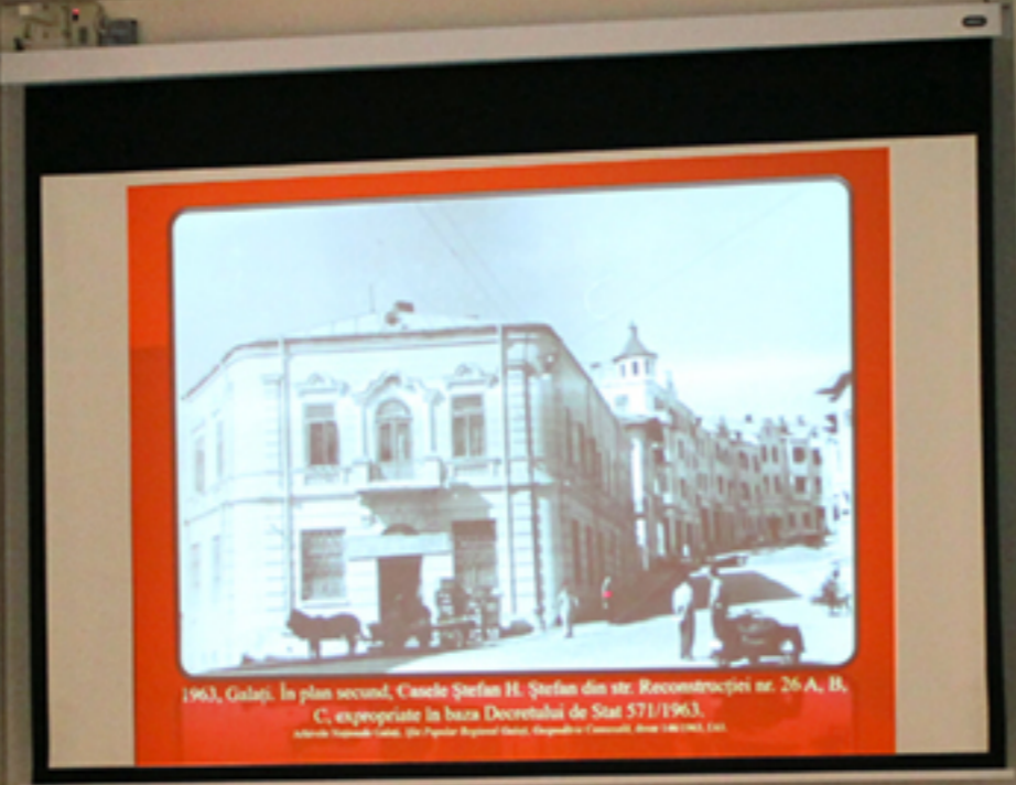
1963, Galați. În plan secund, Casele Ștefan H. Ștefan din str. Reconstrucției nr. 26 A, B, C, expropriate în baza Decretului de Stat 571/1963. Arhivă Națională-Luceafărul, Str. Popovici, Regimul Urban, Regimul de Construcții, Anul 1963, 141.

A woman with short reddish-brown hair, wearing a black and white patterned top and orange pants, stands at a dark wooden podium. She is holding a microphone in her right hand and a small device in her left. She appears to be presenting or speaking to an audience.