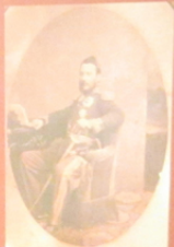
1859. Alexandru Ioan Cuza, Împărat de Jure al Moldovei (?)