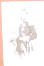
1859. Prințul Alexandru Ioan Cuza, Împărat de Jure al Moldovei