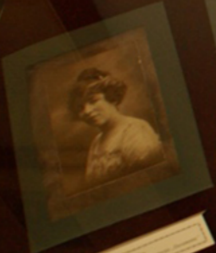
Portrait of a woman, likely a family member of the subject of the exhibit.

Assicurazione di responsabilità per danni alla persona e alla proprietà. La polizza assicurativa è stipulata in base alle condizioni generali e speciali. Per maggiori informazioni rivolgersi al proprio agente assicuratore o al servizio clienti. Assicurazione stipulata in base alle condizioni generali e speciali. Per maggiori informazioni rivolgersi al proprio agente assicuratore o al servizio clienti.