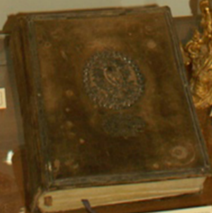
Книга с декоративной обложкой и металлическими элементами