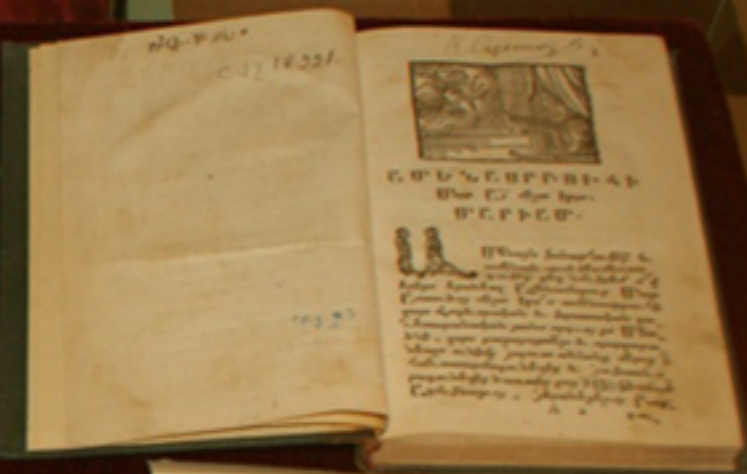
CARTE BISERICEASCĂ, Veneția, 1704, armeros. Biblioteca „F. A. Dinculescu” Galați, Colección Specială - Carte armeros