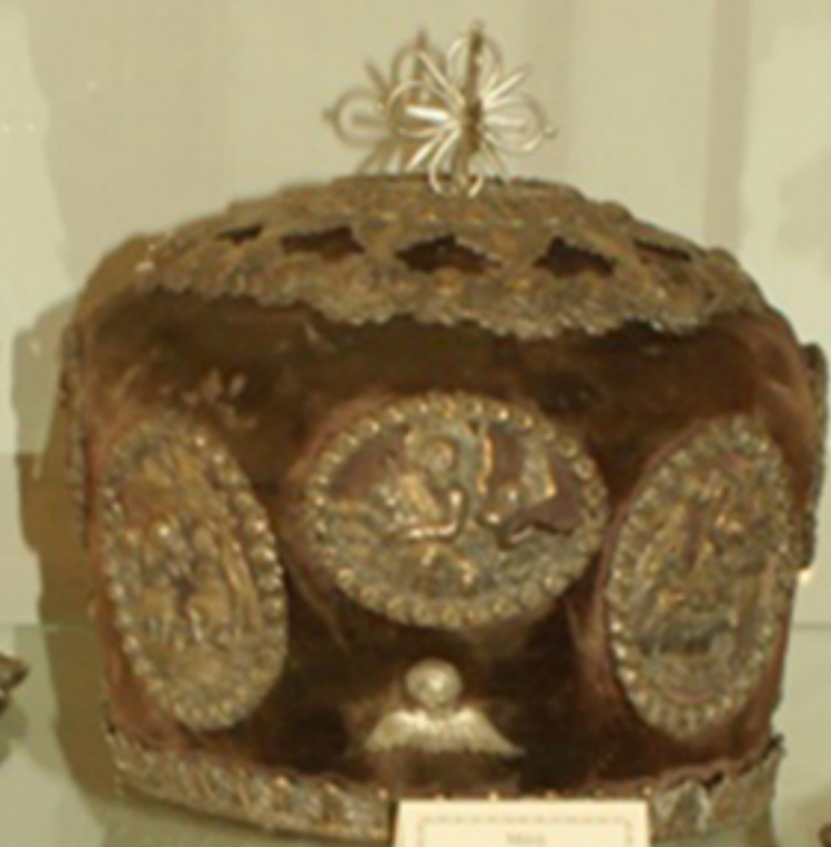
Серебряная шкатулка с декоративными элементами и звездчатым навершием