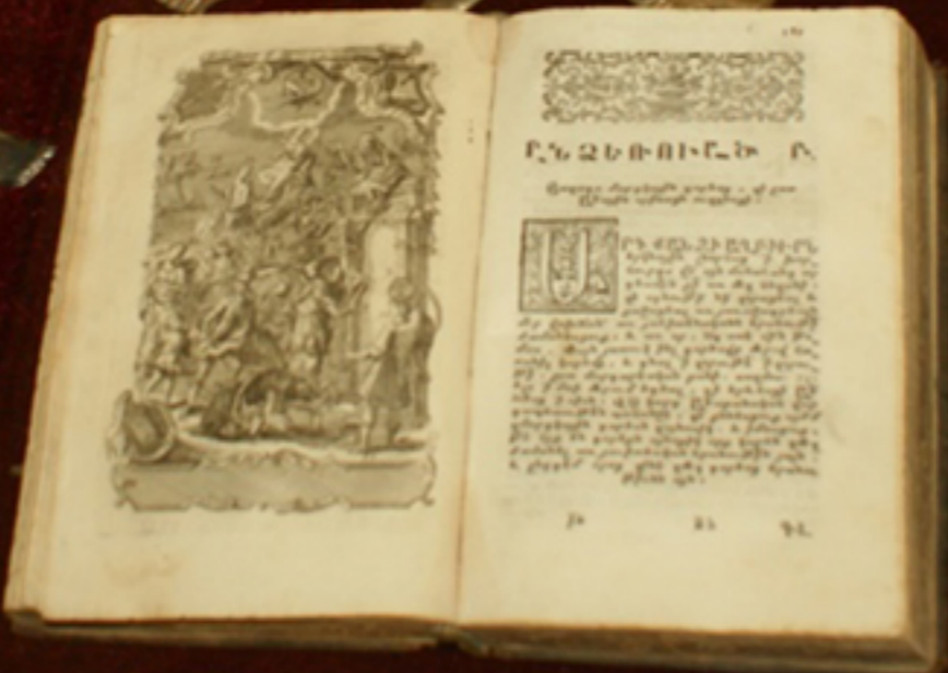
Apotea Iacobinilor, CARTE BISERICEASCĂ, Veneția, 1748, armeros. Biblioteca „F. A. Dinculescu” Galați, Colección Specială - Carte armeros