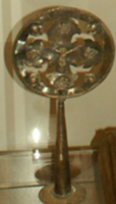
Серебряный поднос с декоративными элементами