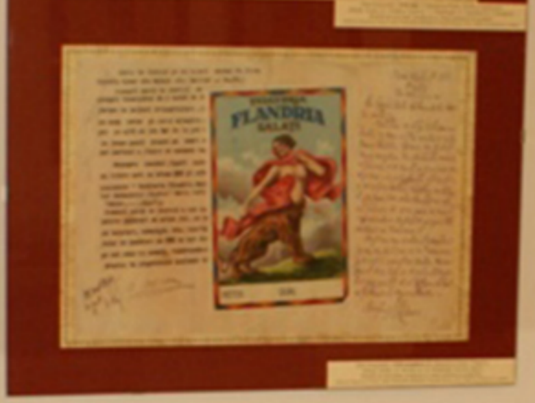
Contribuții la dezvoltarea economică a orașului Corbiș. Măști de fabrică și comenzi utilizate de comercianții ardeleni în timpul războiului mondial.