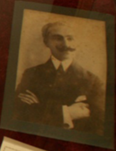
Portrait of a man, likely the subject of the exhibit or a family member.