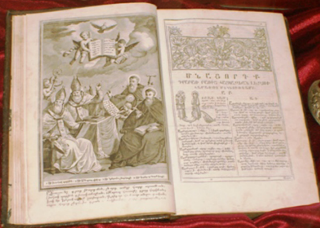
Woodcut from the Compositors' Arsenal Galati