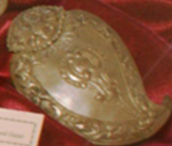
Public Compositors' Arsenal Galati