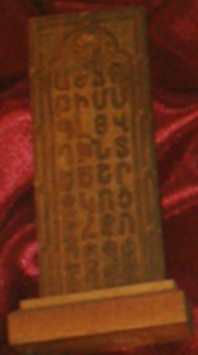
Alphabet wooden Compositors' Arsenal Galati