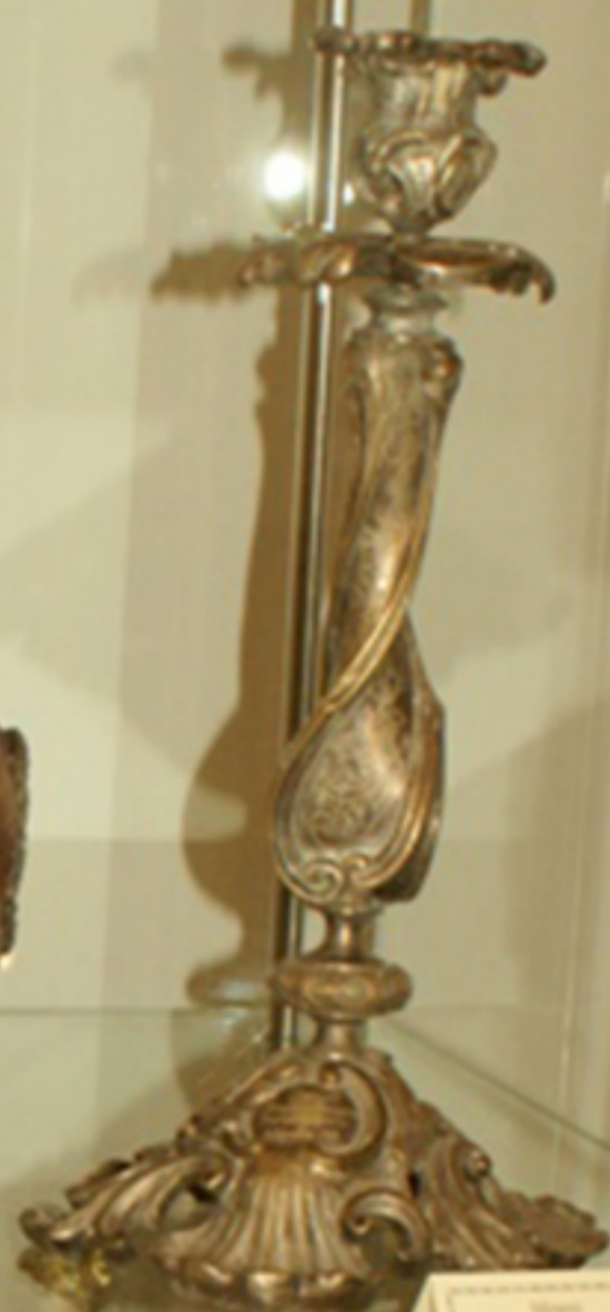
Серебряный подсвечник с изогнутой ножкой и декоративным основанием