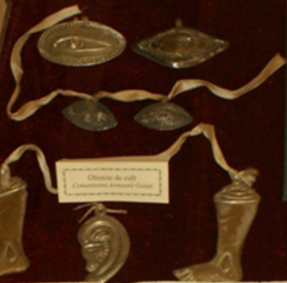
Obiecte de cult Comunitate Armeros Galați