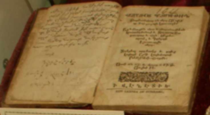
CARTE BISERICEASCĂ, Veneția, 1706, armeros. Biblioteca „F. A. Dinculescu” Galați, Colección Specială - Carte armeros