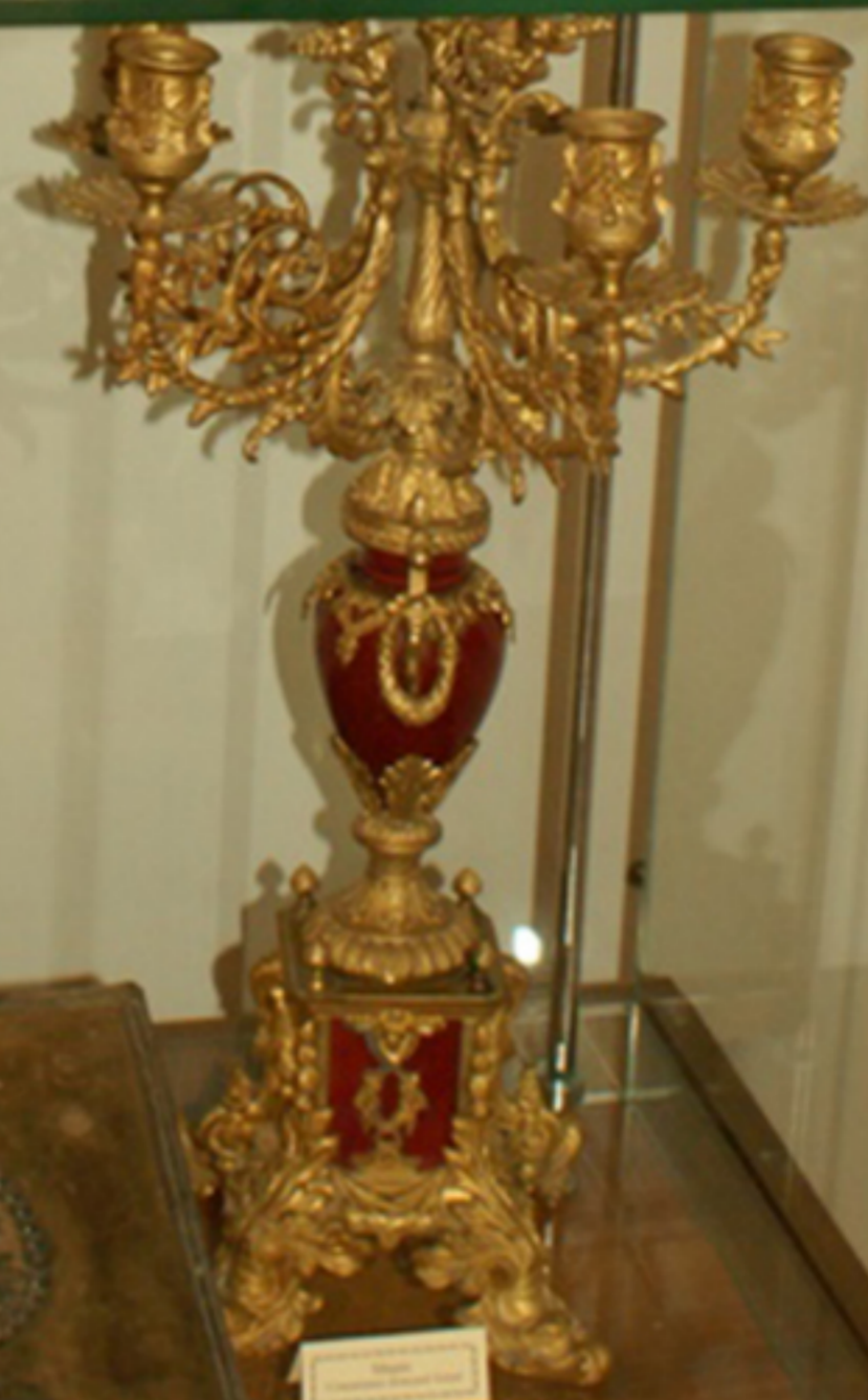
Серебряный канделябр с декоративными элементами