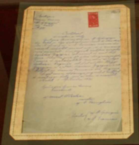
Handwritten letter, likely a personal communication or official document.