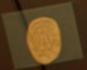
Medal or seal, possibly a commemorative award or official seal.