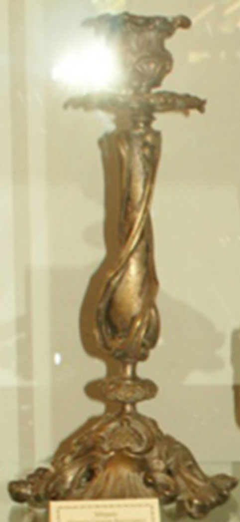
Серебряный подсвечник с изогнутой ножкой и декоративным основанием