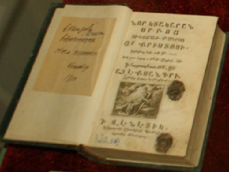
CARTE BISERICEASCĂ, Veneția, 1706, armeros. Biblioteca „F. A. Dinculescu” Galați, Colección Specială - Carte armeros