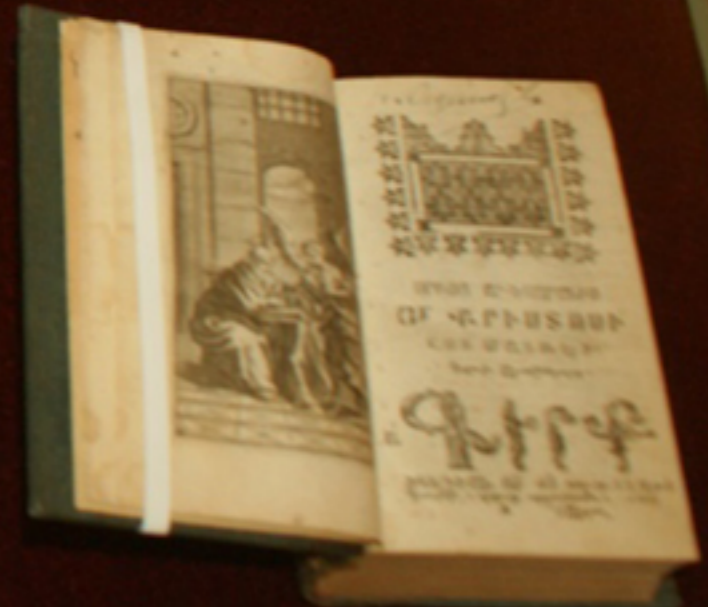
EVANGHELIA ARMEANĂ, Veneția, 1706, armeros. Biblioteca „F. A. Dinculescu” Galați, Colección Specială - Carte armeros