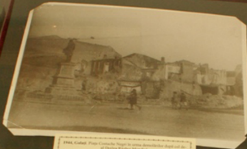
1944, Galati. Piaza Centrala. Sagra in urma bombardierelor din timpul celui de-al Doilea Razboi Mondial.

Handwritten text in a decorative frame, likely a historical document or manuscript.